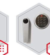
Elektronischschloss kombiniert mit mechanischer Revision